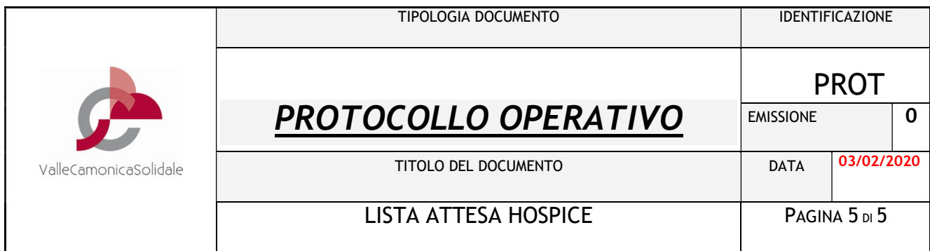
TABELLA GESTIONE LISTA DI ATTESA (allegato 1)